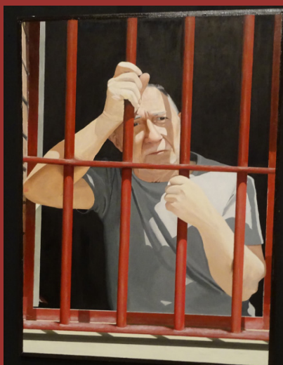
«Pensaments entre reixes» és l'obra guanyadora en la categoria de pintura. Com a novetat d'enguany, l'autor d'aquesta obra ha pogut participar també en el muntatge de l'exposició i en les posteriors visites guiades.

« Sistema incorrecto » Abans d'aprendre a pintar, veia la vida des d'una única perspectiva, gens agradable. Ara puc superar qualsevol obstacle ja que tinc més perspectives i matisos i valoro la part positiva de cada cosa i situació, perquè la vida, en definitiva, és com un la visualitza. Veig que he millorat mentalment i em sento més tranquil i més viu. L'obra «Sistema incorrecto» representa la vida a través dels meus ulls.