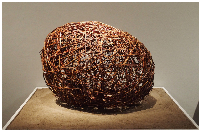
Taller artístic del Centre Penitenciari Quatre Camins