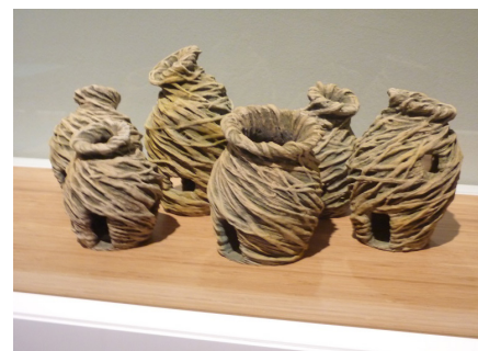
Taller artístic del CP Brians 2

Per això, «Bàlsam i fuga» prioritza la comprensió de l'impuls i la lectura simbòlica de l'expressió creativa abans que l'excel·lència tècnica. Aquest fet és rellevant per entendre la creació a les presons, ja que afecta tant l'esperit com l'estètica de les produccions resultants.