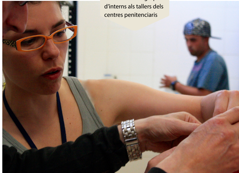
La meua tasca consisteix a treballar amb grups d'interns als tallers dels centres penitenciaris

La meua tasca consisteix a treballar amb grups d'interns al taller i transmetre'ls els continguts teòricopràctics propis de l'enquadernació, juntament amb hàbits i actituds que va bé que adquireixin no solament per poder desenvolupar-se en el meu taller, sinó també en qualsevol àmbit de la vida. Aquests coneixements s'han de reflectir després en les peces resultants, que de vegades es presenten als concursos intercentres, mostres i altres actes que s'organitzen dins i fora dels centres penitenciaris. Evidentment, he de regular i adaptar la quantitat de feina i l'exigència a les capacitats de cada intern, i prefereixo treballar des del reforç positiu que facilita la motivació. Penso que la meua missió és aportar un granet de sorra a cada un dels interns en el seu procés de rehabilitació. I el granet de sorra es fa més gran o més petit segons la predisposició i l'aprofitament de qui el rep. Per sort, als centres penitenciaris hi ha una oferta força diversificada de tallers artístics. La gràcia és que cada intern trobi el tipus