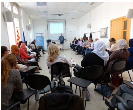
Programa PNUD de les Nacions Unides per al desenvolupament de les presons d'Algèria