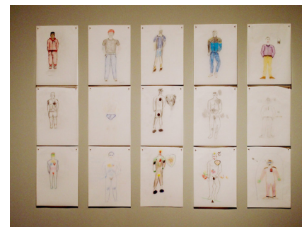
Taller artístic del CP d'Homes de Barcelona

Les obres realitzades pels interns són fruit de l'impuls creatiu que sorgeix de la necessitat d'expressar-se o simplement d'alleugerir el pes del temps. Destil·len honestat i cruesa i sovint són expressions metafòriques d'una realitat que els és molt difícil d'explicar.