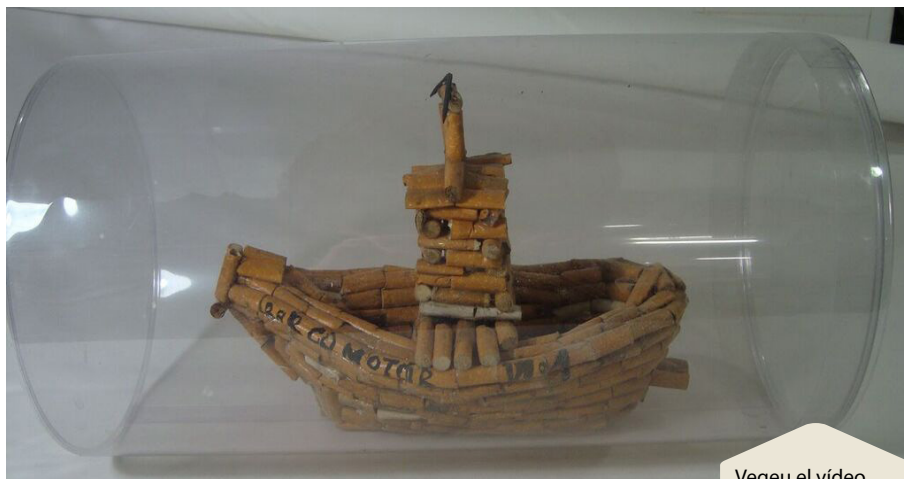
Vegeu el vídeo del recorregut de l'exposició