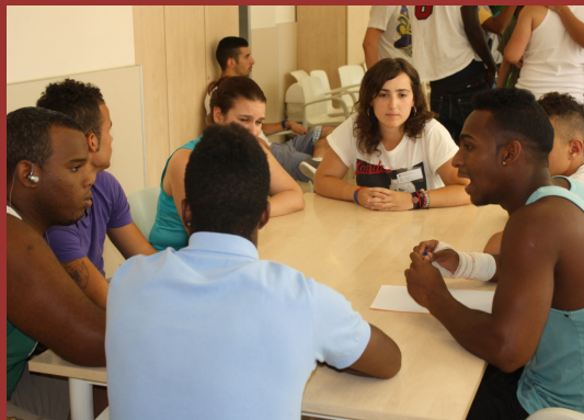
Mòduls de participació i convivència

L'objectiu de la intervenció amb NFB, que continua aquest 2017 amb interns de Brians 2, és valorar si la seva aplicació conjunta amb psicoteràpia facilita la rehabilitació. La hipòtesi principal és que el tractament amb NFB és més efectiu que el placebo per millorar els comportaments i les respostes agressives i impulsives en un grup d'interns del MR8 de Brians 2.