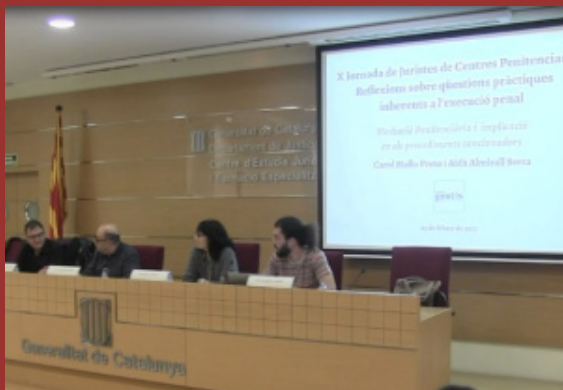
Jornada de Juristes de Centres Penitenciaris