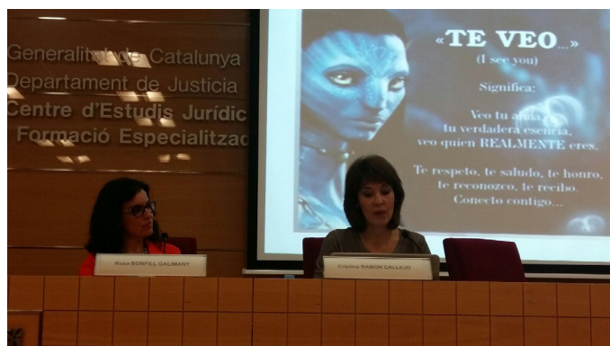
Jornada anual de Treballadors Socials del Departament de Justícia

Una de les activitats principals és la Jornada anual de Treballadors Socials del Departament de Justícia, que es realitza en el Centre d'Estudis Jurídics i Formació Especialitzada (CEJFE), atès que representa la visualització del col·lectiu de treball social en l'àmbit penitenciari i és l'espai relacional interprofessional per excel·lència. El 2016 se'n va dur a terme l'onzena edició, amb una clara consolidació de la trobada. Podeu consultar la publicació al blog sobre