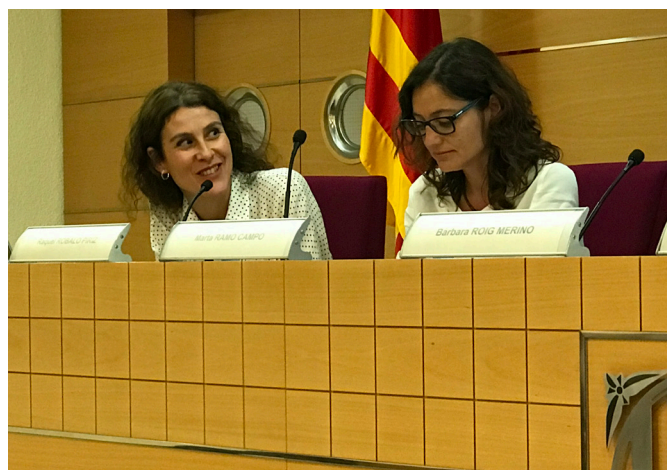
Jornada de Treballadors Socials del Departament de Justícia

Finalment, existeix un voluntariat que intervé en el medi obert i postpenitenciari que té una importància rellevant atès que acompanya les persones en l'última fase de la condemna, com el projecte pilot L'acompanyament a la sortida en llibertat d'interns dels centres penitenciaris de Barcelona i cercles de suport i responsabilitat ( Cercles ).