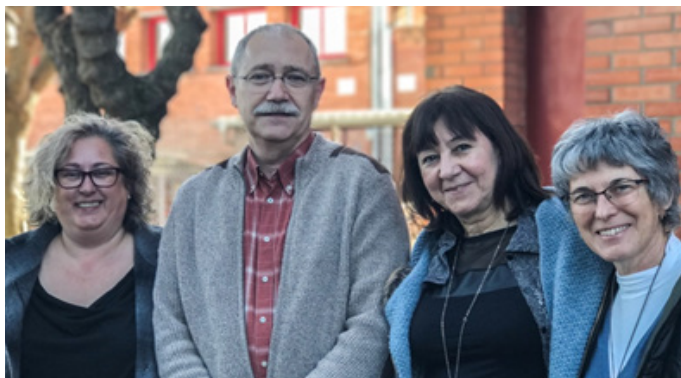
Caps de servei i caps de secció territorial dels equips de treball social

Des de la URC treballem per donar suport a tots els professionals i compartim espais de trobada amb els responsables dels equips de treball social per fomentar la cohesió i acordar les línies de treball organitzatives i de planificació a tot el territori.