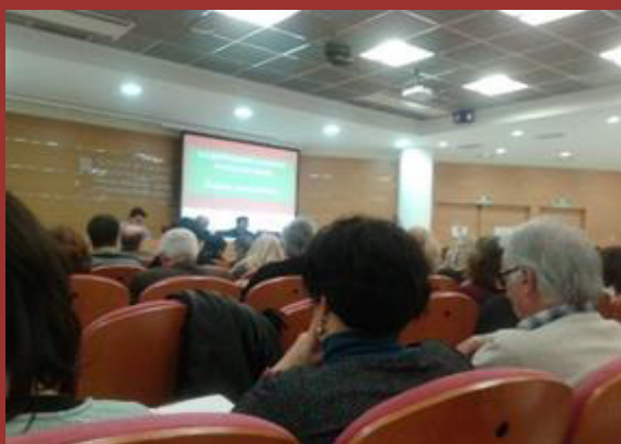
Taules de participació social

S'han establert algunes mesures de suport que facilitaràn el seu funcionament: des de Serveis Penitenciaris s'ha designat, per a cada centre de règim ordinari, un referent per a la TPS. Pel que fa a la part social, una de les entitats de la taula de primer nivell s'encarregarà d'acompanyar i donar suport a les entitats representants de cada taula perifèrica. S'han facilitat espais digitals per compartir actes i informacions. Cada centre té –o s'està treballant conjuntament entre el centre penitenciari i la part social– un pla d'actuació per millorar l'eficàcia i compartir objectius.