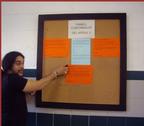
Mòdul 2 del Centre Penitenciari Quatre Camins