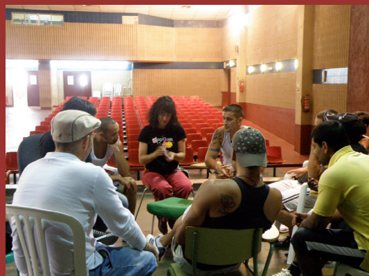
Tractament amb neurofeedback en un centre penitenciari