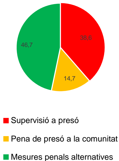
Figura 1. Supervisió dels infractors penals a Catalunya (2021)