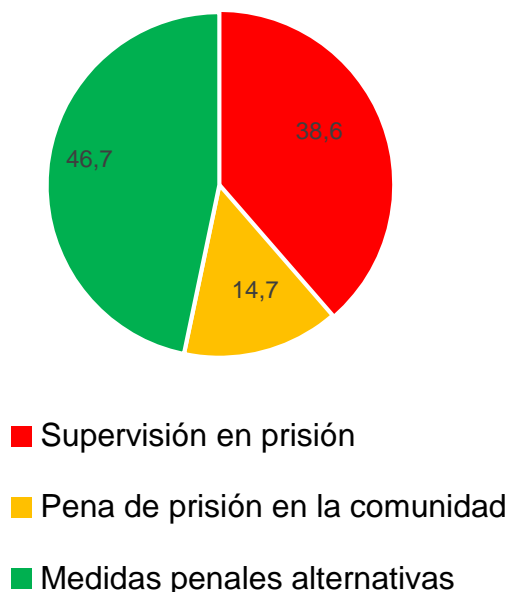
Figura 1. Supervisión de los infractores penales en Cataluña (2021)