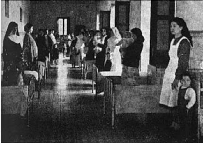
Mujeres encarceladas Presó/Convent de les Corts (Barcelona)