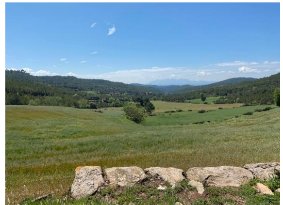
La Creu del Perelló i la vista a Montserrat