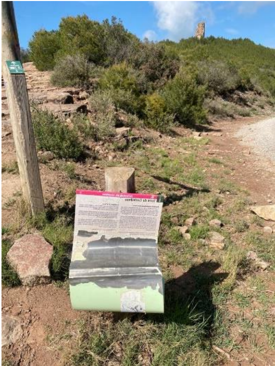
Torre de Castellnou