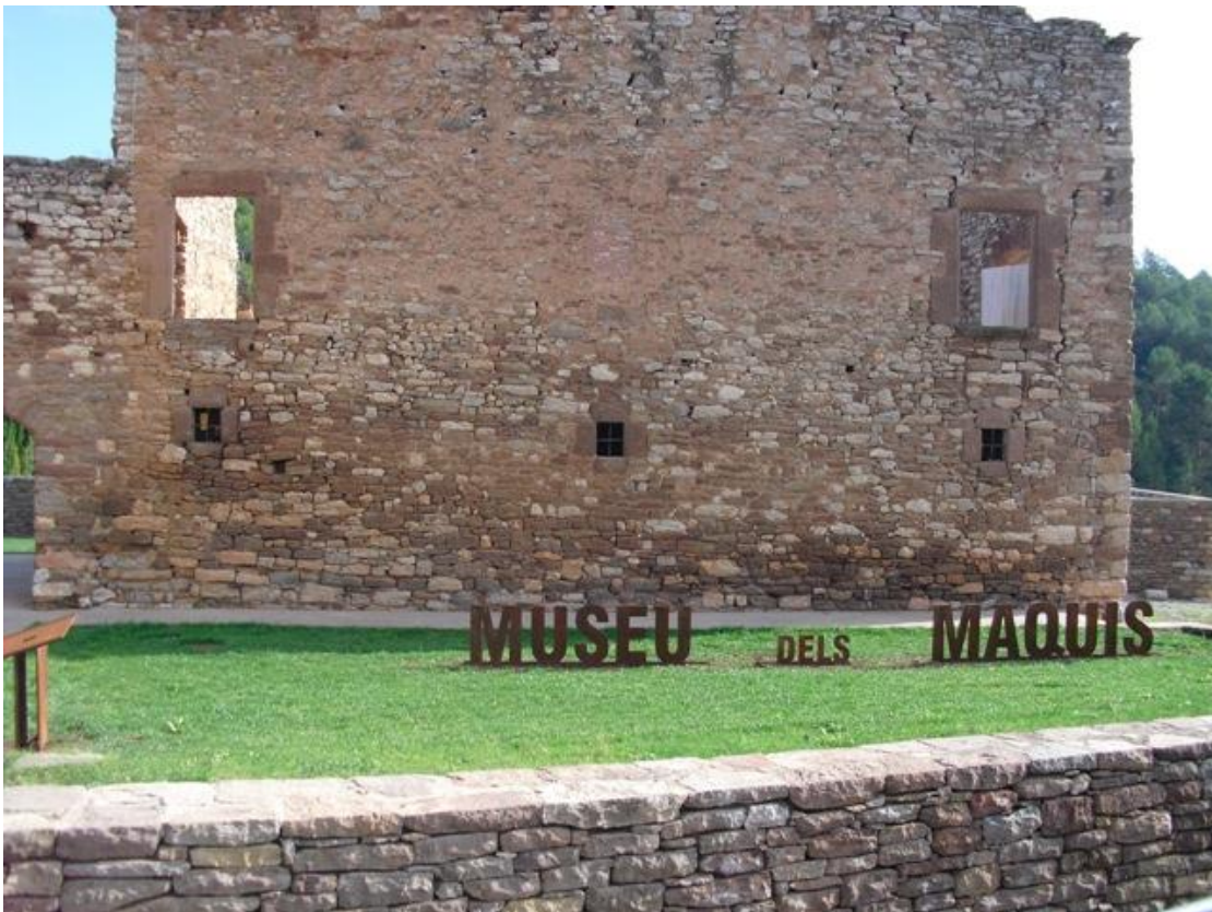
Parterre on actualment està la fossa 2 per exhumar.