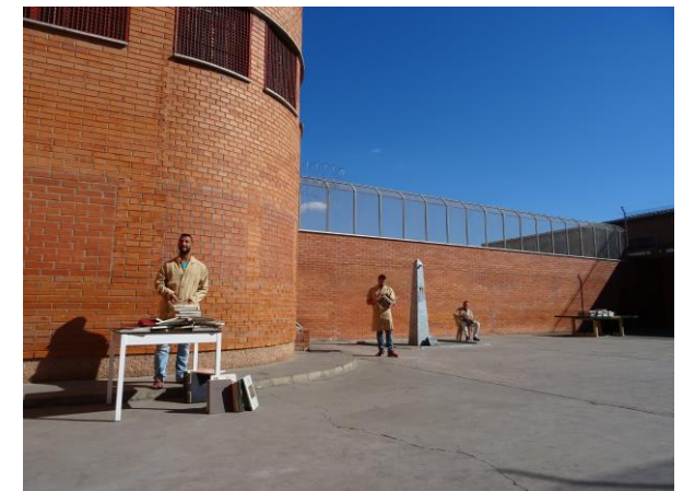
Temps sota el sol , Ponent (CC BY-NC-ND ) Primer premi del Concurs Lectura i presó 2017

Barcelona 19 d'abril-13 de juliol de 2018