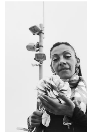
Letras en flor 4 , del CP Mas d'Enric, 1r accèssit 2017 (CC BY-NC-ND )

A la inauguració el 19 d'abril a les 12 h, un jurat de professionals premiarà les millors obres.