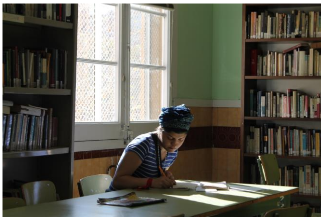
En silenci parlo amb tu , del CP Dones, 2n accèssit 2017 (CC BY-NC-ND )

El concurs dona l'oportunitat de difondre, dins i fora de la presó, l'activitat cultural i educativa que s'hi duu a terme. A més permet fomentar la lectura i motiva la creativitat entre els interns.