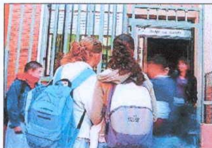
Acoso escolar. Las denuncias en los centros escolares van en aumento. Arciniega

Pese al aumento de las denuncias, hay un grupo de padres que se arrepiente e intenta dar una nueva versión de los hechos, probablemente más benévola, para conseguir la retirada de medidas cautelares, como el internamiento en centros o el ingreso de centros de convivencia.