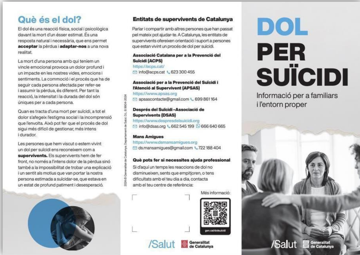
Tríptic sobre el dol per suïcidi