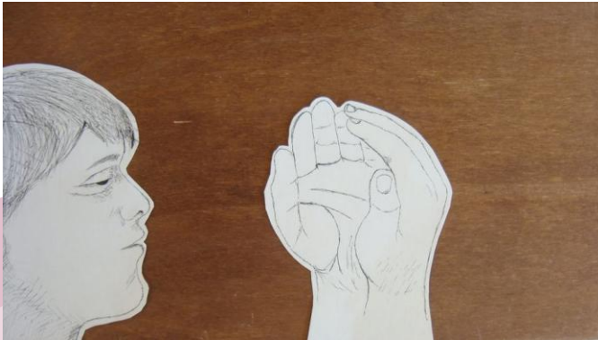
Taller Artístic del CP Brians 2

Des de darrere la concertina, els monitors dels tallers pretenen utilitzar l'art com a motor de transformació en l'individu i explorar noves vies de desenvolupament creatiu i plàstic.