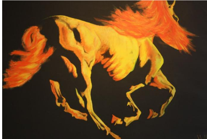
Taller Artístic del CP de Joves

La pràctica artística es treballa als centres com a via de reconstrucció dels valors i l'autoestima necessaris en tot procés de rehabilitació de les persones privades de llibertat. Els tallers dels centres penitenciaris ofereixen un ventall d'activitats ampli per tal que cadascú en tregui profit i pugui crear d'acord amb els seus recursos. Proposen formació en arts visuals (pintura, escultura, fotografia, etc.), arts escèniques, com el teatre i la música, i altres disciplines, com l'enquadernació, que poden aportar un valor afegit al currículum quan els interns reprenen la vida fora.