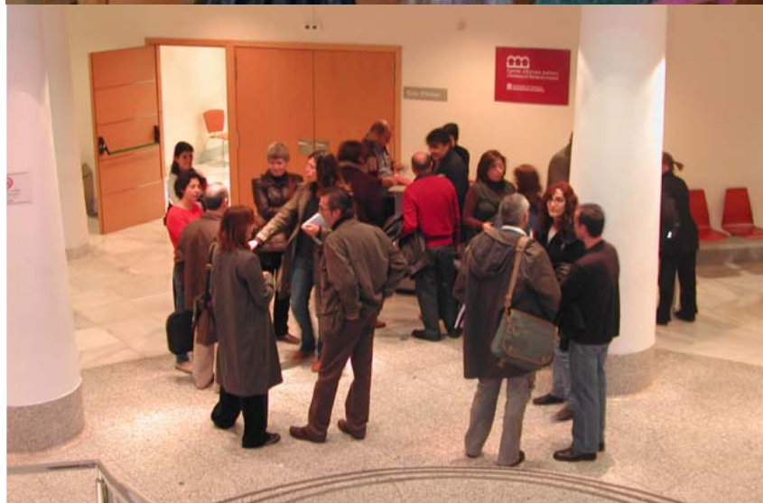
Comunitats justícia juvenil