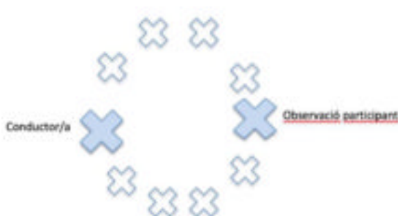
Figura 3. Ecologia grupal i disposició dels professional en el model 3

En aquest cas els dos professionals estan dins de la rodona grupal, però amb rols clarament diferenciats. D'una banda hi ha el professional que condueix el grup amb el rol de facilitar els processos d'evolució grupal i personal, i d'altra banda hi ha el professional que té un rol d'observació participant. Això vol dir que aquest professional es troba dins de la rodona i, per tant, pot participar de la dinàmica, però també fa l'acta per tal de poder analitzar allò que ha passat a la sessió. Hi ha la possibilitat de fer una observació no participant, però en aquest context no és recomanable perquè provoca moltes resistències personals.