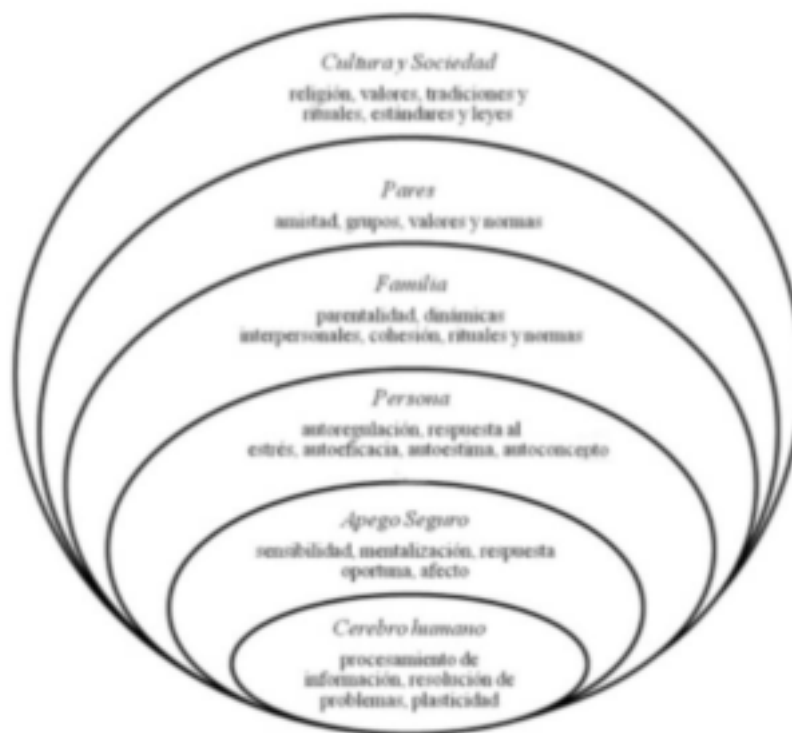
Figura 1: Sistemes i processos involucrats en la resiliència