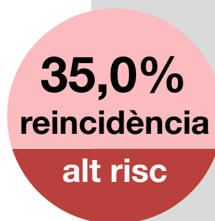
Gràfic 2. Taxa de reincidència en excarcerats d'alt risc