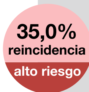
Gráfico 2. Tasa excarcelados de alto riesgo