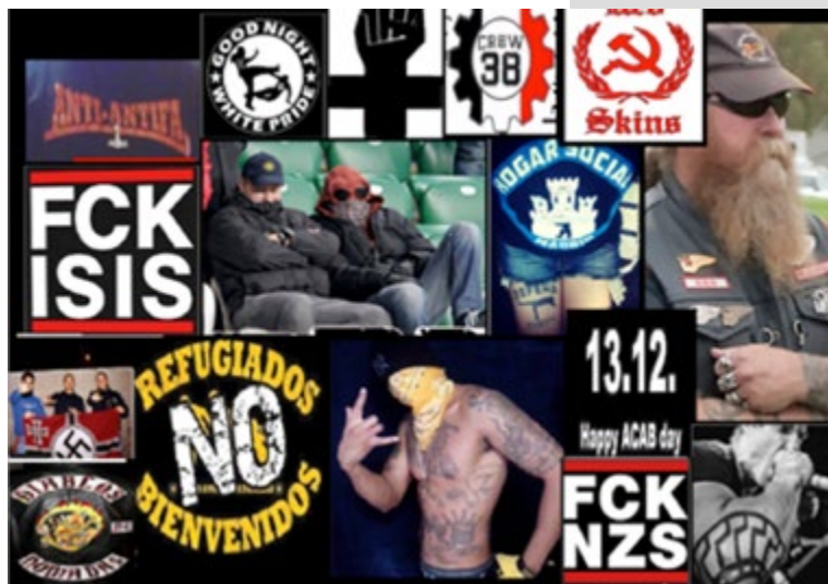
Il·lustració 1: Formes d'exterioritzar l'agressivitat a través dels símbols

2. Els GUV tenen un ampli repertori de simbologia violenta que difonen per molts canals. Intenten sintetitzar un discurs d'odi i violència a través d'una imatge, objecte o forma de vestir. No transmeten cap valor positiu als membres del grup; són organitzacions en què la base de les seves cosmovisions i socialització aplega l'admiració per la violència i l'odi al diferent o al rival. La ideologia violenta comporta un compromís gradual amb un conjunt de rols, valors, regles, creences i normes que legitimen un discurs i uns símbols agressius. La dicotomia (blanc o negre) divideix el món entre nosaltres i ells . La manera més estesa d'exterioritzar (objectivar) l'agressivitat i el fanatisme és a través del símbol i el discurs.