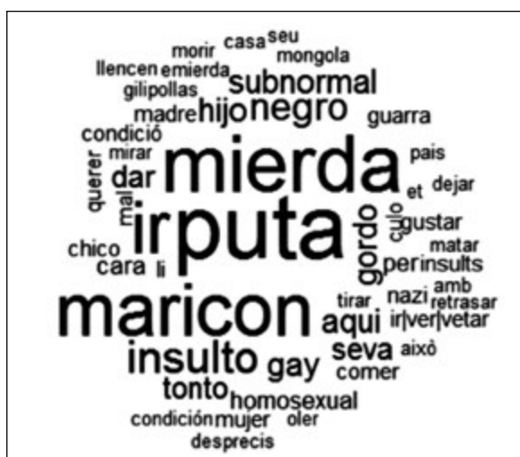
Gràfic 2. El núvol d'insults i ofenses a la víctima

Les víctimes, moltes vegades amb una condició de vulnerabilitat, són seleccionades intencionadament i pateixen una violència gratuïta que atempta contra la seva seguretat i integritat, fet que provoca uns efectes devastadors en l'àmbit moral, psicològic i social, i que molts cops es perpetuen en el temps.