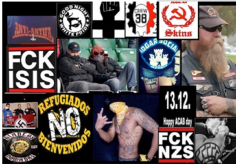
Ilustración: Formas de exteriorizar la agresividad mediante símbolos

Intentan sintetizar un discurso de odio y violencia a través de una imagen, objeto o forma de vestir. No transmiten ningún valor positivo a los miembros del grupo; son organizaciones donde la base de sus cosmovisiones y de su socialización reúne la admiración por la violencia y el odio al diferente o al rival. La ideología violenta comporta que vayan comprometiéndose con un conjunto de roles, valores, reglas, creencias y normas que legitiman un discurso y unos símbolos agresivos. La dicotomía (blanco o negro) divide el mundo entre nosotros y ellos. La manera más extendida de exteriorizar (objetivar) la agresividad y el fanatismo es a través del símbolo y el discurso.